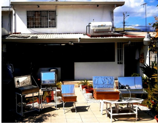
PHOTOS: DIFERENTES ARTEFACTOS SOLARES EN FUNCIONAMIENTO .